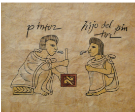
"Tlacuilo enseñando a su hijo" Alfredo Guati Rojo

El tlacuilo pintaba los códices y los murales en Mesoamérica y podía trabajar en mercados y templos, según el tipo de actividad para el que se le requiriera.